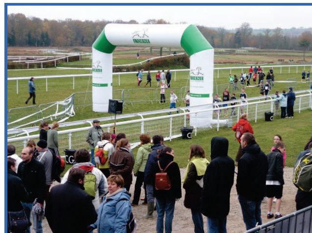
La ligne d'arrivée du CROSS aux couleurs du Conseil Général de l'Orne