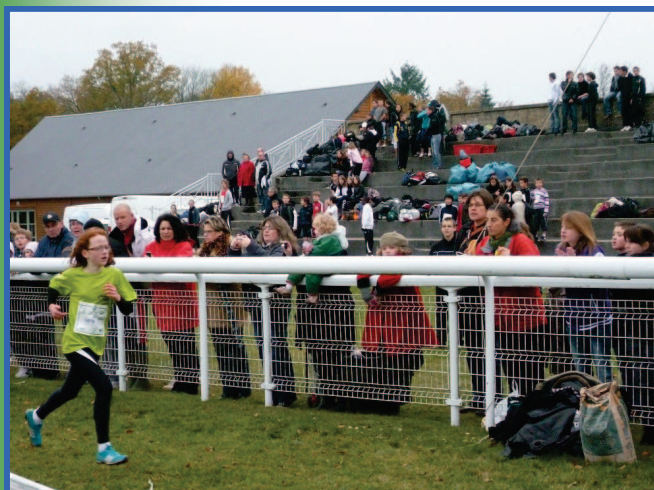
... encore quelques mètres sous les encouragements...