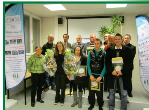
Tous les lauréats rassemblés avec les membres du CDOS 61 et du CG 61

Cette première édition des Trophées du Bénévole fut une grande réussite.