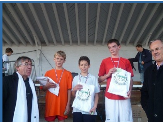
Podium des 6ème garçons