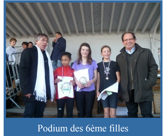
Podium des 6ème filles