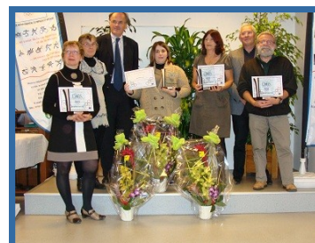
L'ensemble des lauréats de la soirée avec les représentants du CDOS 61 et du CG 61